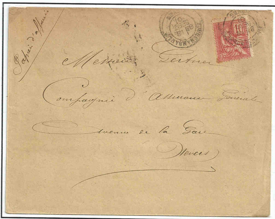
Enveloppe ayant contenu des papiers d'affaires au 2 e échelon de poids (de 50 à 100 grammes) du 20 avril 1901 affranchie à 10 centimes (timbre au type II).