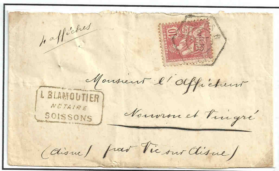
Bande ayant entouré quatre affiches correspondant à des imprimés ordinaires au 2 e échelon de poids (50 à 100 grammes) du 1 er septembre 1903 affranchi à 10 centimes (timbre au type retouché).