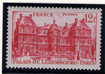
le 12 francs rose carmin émis le 10/05/1948