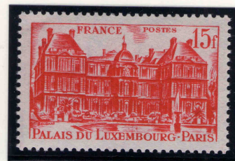
le 15 francs vermillon émis le 9/12/1948