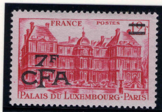
le 12 francs rose carmin surchargé 7 francs CF émis le 01/01/1949