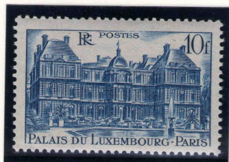
le 10 francs bleu émis le 29/07/1946