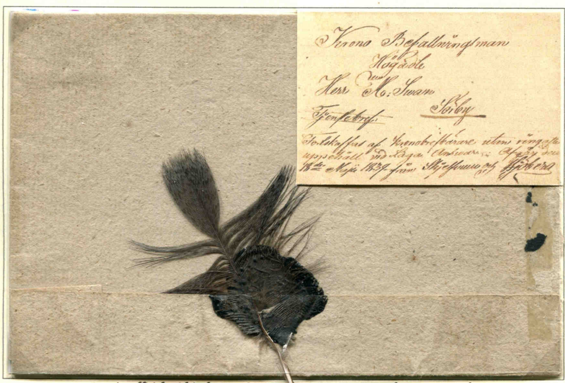
Courrier officiel suédois du 18 mai 1839 acheminé en Express par la Poste Générale. Les mentions « Lettre administrative » et « expédiée par express par le préposé de la perception sans délai sous sa responsabilité » confèrent le caractère urgent de son acheminement. Les plumes scellées sur le courrier confirment que la lettre doit être délivrée par Express. Elles furent utilisées à partir de 1750 et symbolisaient la rapidité du vol des oiseaux. Une plume noire scellée indique sa distribution de nuit avec un certain degré d'urgence supplémentaire.

Chez l'oiseau, les structures de la peau sont les plumes.