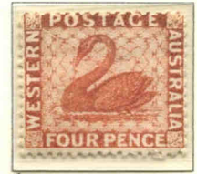
Émission d'avril 1888, imprimé par De La Rue à partir des planches de Perkins, Bacon & Co.