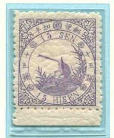
Émission du 1.1.1875. Timbre de la planche 1 reconnaissable à la syllabe japonaise (i)

Imprimé en typographie sur du carton couleur chamois. Émis le 10 janvier 1949. Pli avec complément d'affranchissement insuffisant pour l'Italie. Taxé à 27 lire à l'arrivée, qui correspondent à 4 c de dollar U.S., 2 c pour le port, 2 c pour la pénalité. Timbres collés sur l'entier et sur une enveloppe de service réservée à la taxation des plis.