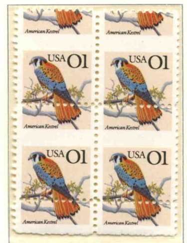
Émission 22.06.1991, perforé 11, imprimé par American Bank Note C°.

Elles servent essentiellement à diriger et à stabiliser le vol.