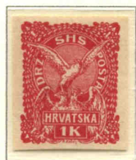
Émission spéciale de 1919 au profit de la Croatie et de la Dalmatie. Tirage non dentelé.

Les fonctions assurées par celles-ci, essentielles pour sa survie, sont le vol, la régulation thermique, l'imperméabilité, le camouflage et l'ornementation.