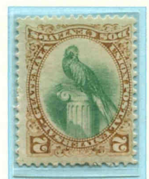
Émission du 7-11-1881, dite « le Petit Quetzal ». Timbre gravé, dentelé 12x12. Centre renversé. La Cie American Bank Note l'a imprimé en deux phases, centre puis cadre, d'où inversion sur quelques rares feuilles.