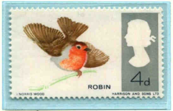
Émission du 8.08.1966 sans bandes de phosphore. Absence de la couleur rouge-brun et du début du nom du graveur.