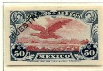
Épreuve non dentelée, surcharge « Muestra », pour l'émission du 13-10-1927.

Les rectrices (du latin rectrix : guide) sont les plumes de la queue. On en compte de 10 à 12 chez la majorité des oiseaux tel le Paradisier.