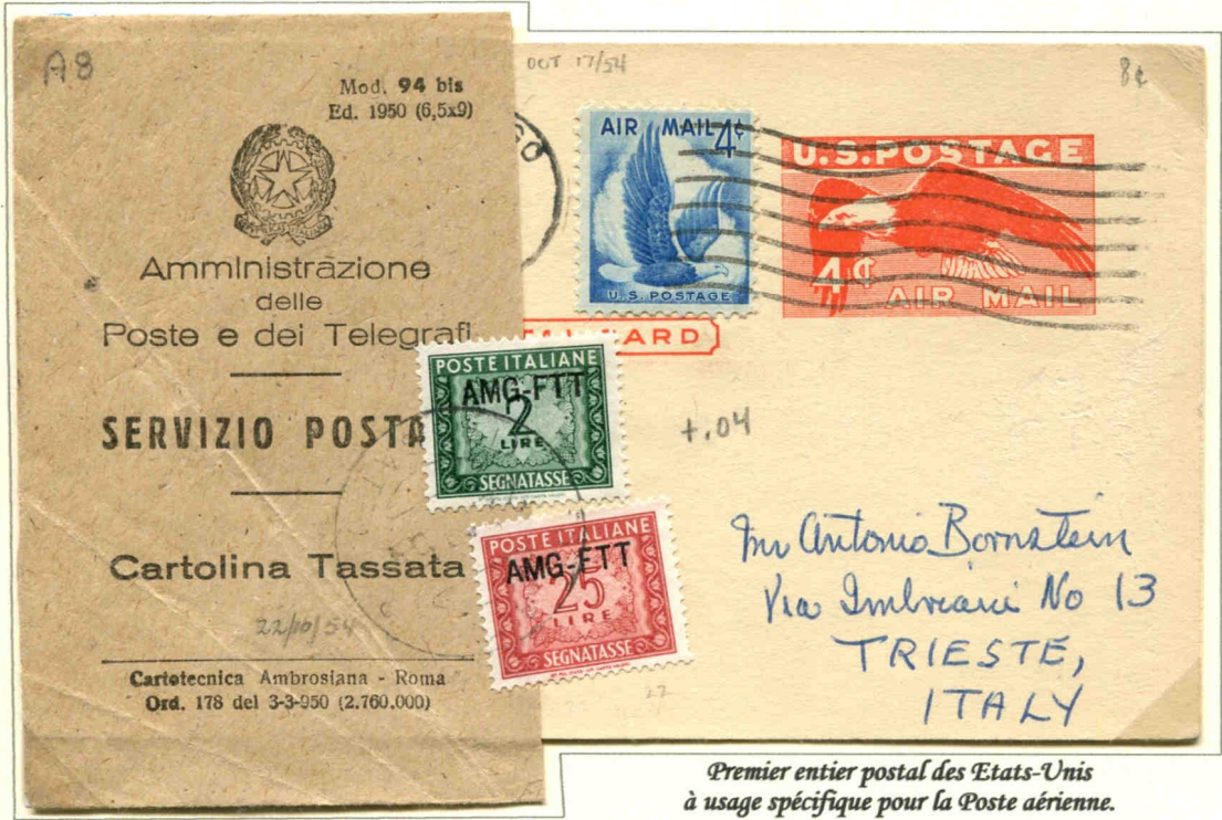
Premier entier postal des Etats-Unis à usage spécifique pour la Poste aérienne.

Imprimé en typographie sur du carton couleur chamois. Émis le 10 janvier 1949. Pli avec complément d'affranchissement insuffisant pour l'Italie. Taxé à 27 lire à l'arrivée, qui correspondent à 4 c de dollar U.S., 2 c pour le port, 2 c pour la pénalité. Timbres collés sur l'entier et sur une enveloppe de service réservée à la taxation des plis.