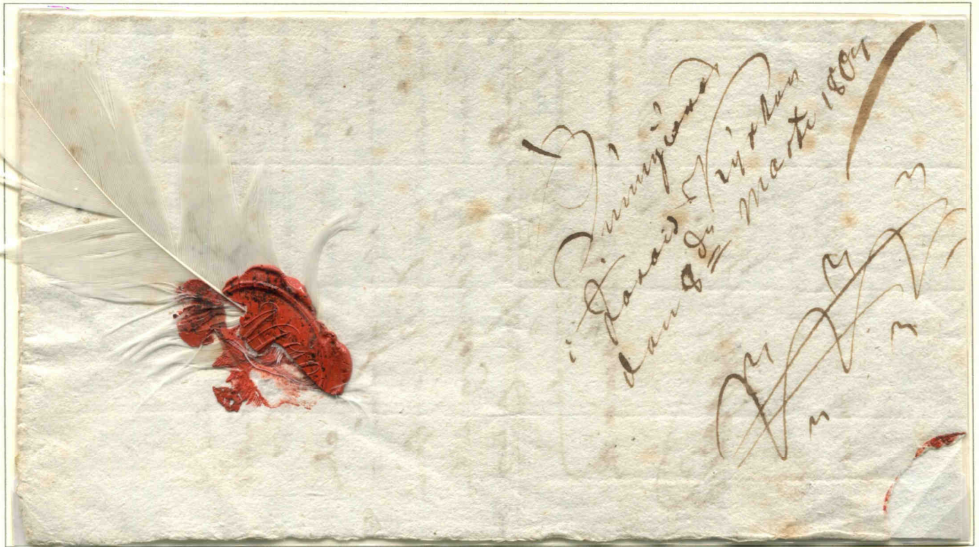
Courrier suédois du 8 mars 1804 acheminé par la Poste de la Couronne, complément important de la Poste Générale. Créée au XVII e siècle, elle cessa de fonctionner le 31 décembre 1873. Cette représentation hélicoïdale d'une couronne date de 1733 et prouvait le caractère officiel du courrier. La plume blanche scellée sur la lettre signifie sa distribution de jour avec un certain degré d'urgence.

Les deux types fondamentaux sont les plumes ou pennes de contour (ci-dessous) et le duvet qui forme la chaude couverture du corps sous les précédentes.