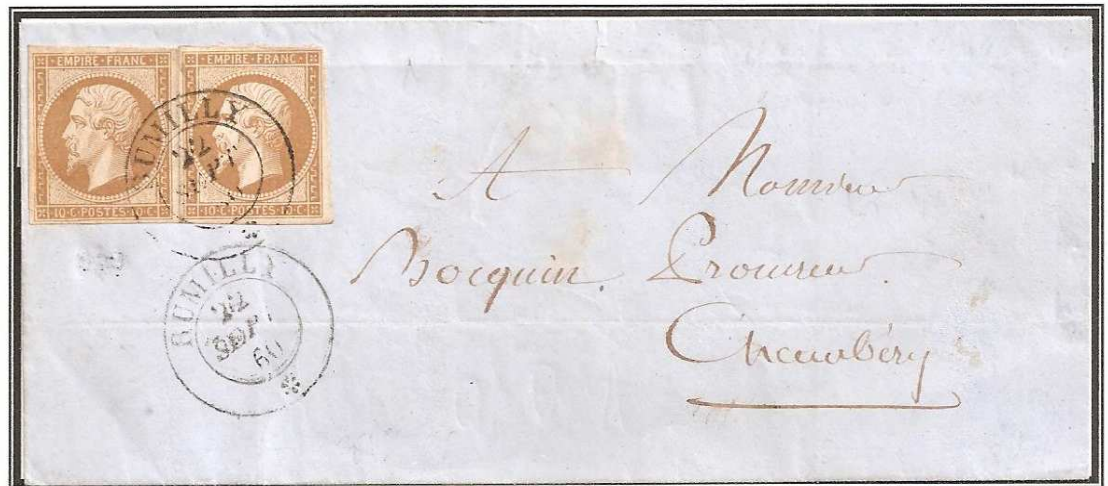
Lettre de RUMILLY du 22 Septembre 1860 en port simple affranchie avec deux 10 centimes Empire non dentelé.