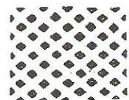
Grille de Chambéry

Dès l'annexion de la Savoie et de Nice (traité de Turin 24 Mars 1860 ratifié par le Sénat français le 12 Juin), la poste française s'installe à partir du 14 Juin 1860 à la suite et dans les anciens bureaux Sardes. Dépourvus de matériels, les agents français utilisent les cachets Sardes durant 3 mois et demi, voire davantage pour certains de ces bureaux qui n'en seront pourvus que début 1861!