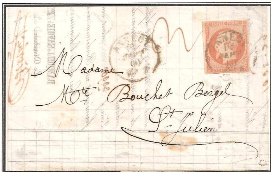
Lettre d'ANNECY du 17 Septembre 1860 en double port avec un 40 centimes Empire non dentelé.