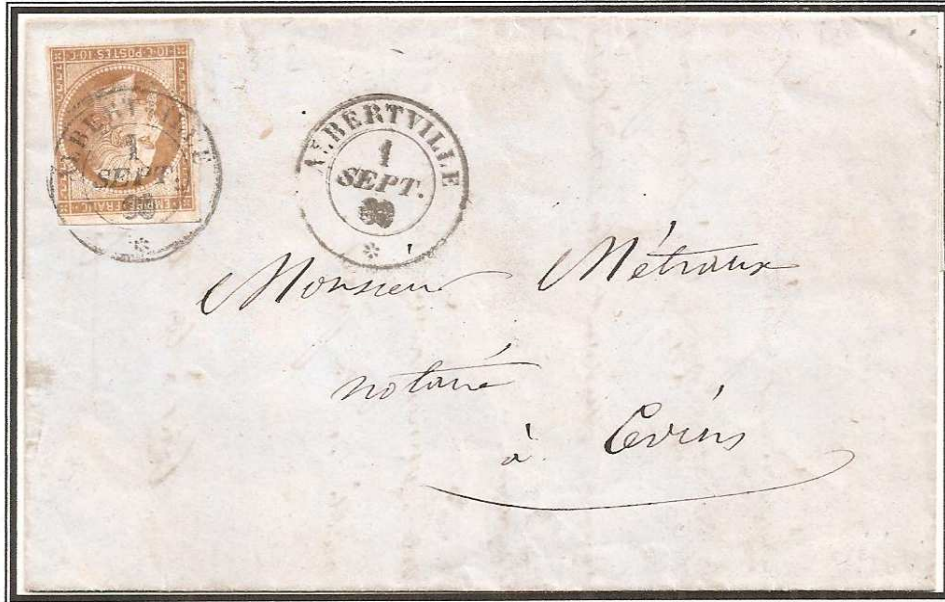
Lettre d'ALBERTVILLE du 1 er Septembre 1860 en port local affranchie avec un 10 centimes Empire non dentelé.