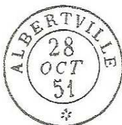
Bureau de Direction