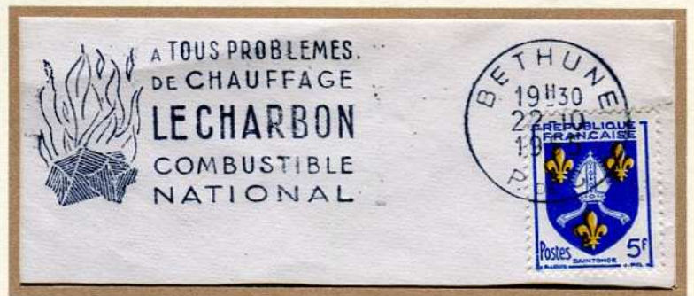
Flamme SECAP de 1955 - utilisée à Béthune de 1955 à 1958. Tarif imprimé

En 1882, La Nouvelle Zélande n'hésitait pas à faire de la publicité au dos des TP.