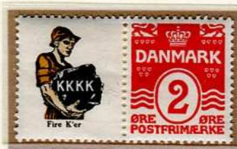
Timbre de 1938 avec publicité attenante

Le charbon fait partie de cet héritage qui permet à l'homme de se chauffer depuis environ le XVe siècle en France et en Europe.