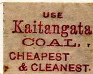
Publicité dorsale sur TP de Nouvelle Zélande de 1882 avec fil. NZ ☆