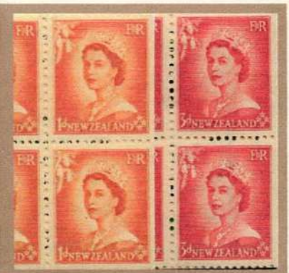
Carnet de TP de Nelle Zélande de 1954 avec 12 TP à 1d et 12 TP à 3d. avec filigrane NZ + étoile.