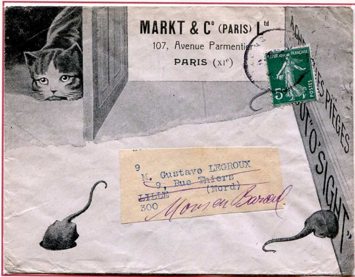
Lettre au tarif papier de commerce et d'affaires. Tarif du 1er mai 1910, soit 5c.

Il faut que je prévienne rapidement la concierge qu'elle aura en pension Mistigri pendant mon voyage.